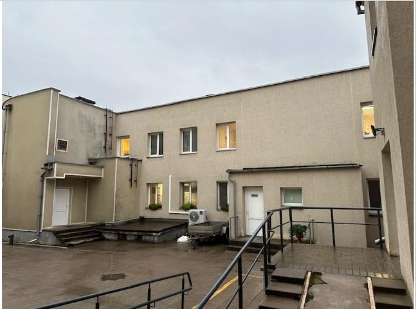
Pastato (jo dalies) fotonuotrauka

Pastatų energinio naudingumo sertifikavimo ekspertas